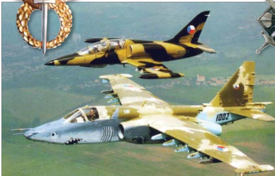
V našem vojenském letectvu působily vedle sebe i nadále letouny ruské (Su-25, vpředu) a naší proveniencie (L-39)