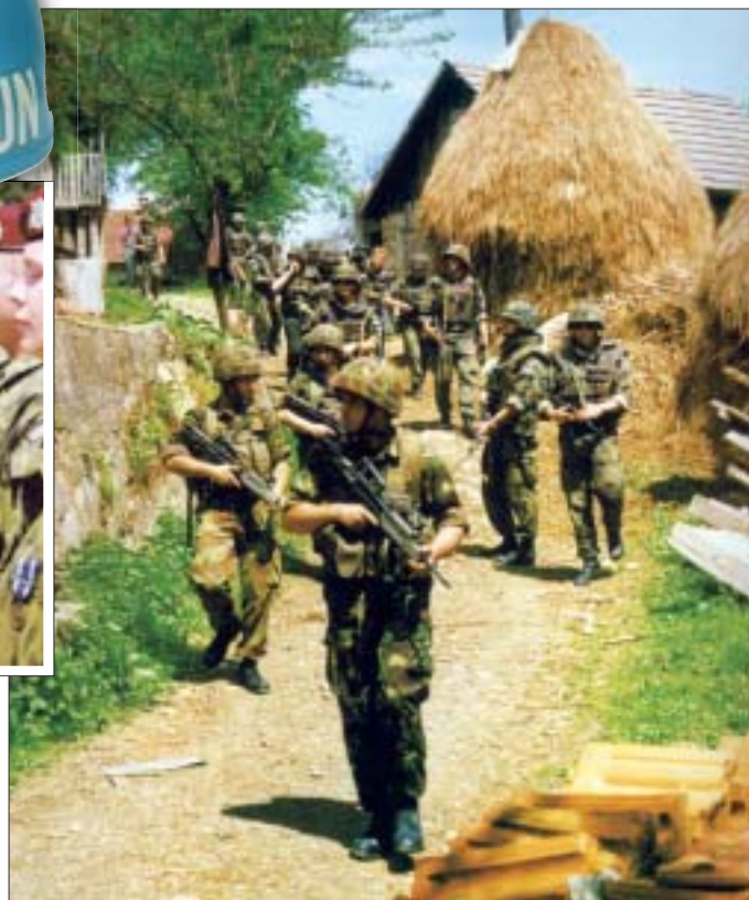
Společná česko-britská hlídka na území Bosny a Hercegoviny