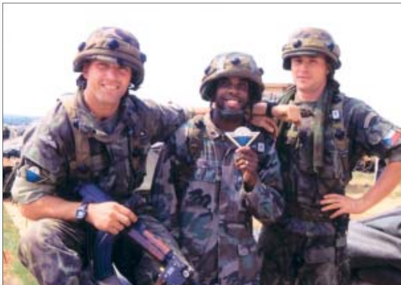
Příslušníci naší armády se začali pravidelně zúčastňovat vojenských cvičení v zahraničí. Pravděpodobně vůbec nejdál se dostali v roce 1995, kdy se zapojili do cvičení Cooperative Nugget na území USA. I zde šílili prokázanými kvalitami dobré jméno AČR.

V květnu 1991 se stal náčelníkem GŠ gen. Karel Pezl. Právě za jeho funkčního období byly zrušeny Západní vojenský okruh, 1. a 4. armáda a Východní vojenský okruh, jejichž nástupci se 1. ledna 1992 stala nově postavená vojenská velitelství Západ v Táboře, Východ v Trenčíně a k 1. březnu 1992 vytvořené Vojenské velitelství Střed v Olomouci. Další reformování armády však zbrzdila situace po parlamentních volbách, kdy politická reprezentace rozhodla o rozdělení Československa. Generální štáb musel připravit náročné dělení federální armády na dva samostatné celky, jehož hladké zvládnutí nám získalo mezinárodní uznání. Dnem 1. ledna 1993 vznikla samostatná Česká republika a již v prvních měsících její existence Generální štáb připravil a řídil rozsáhlou transformací armády, která vycházela z „Konceptu výstavby AČR do roku 1996“. V jejím průběhu došlo k rovnoměrnému rozmístění útvarů po celém území republiky a k výraznému snížení mírového počtu, který klesl na 65 000 osob. Současně s výstavbou nové armády zabezpečoval GŠ i vysílání českých kontingentů do mírových operací na Balkáně.