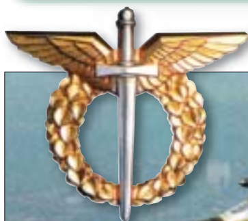
Český pilotní odznak