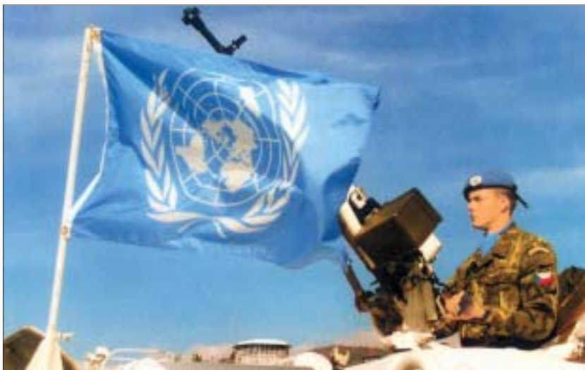
Polovina devadesátých let je v historii Armády České republiky nerozlučně spjata s mírovými operacemi pod vlajkou OSN na území bývalé Jugoslávie